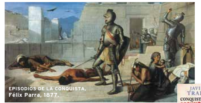
EPISODIOS DE LA CONQUISTA, Félix Parra, 1877.