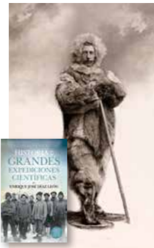
El noruego AMUNDSEN en 1899.