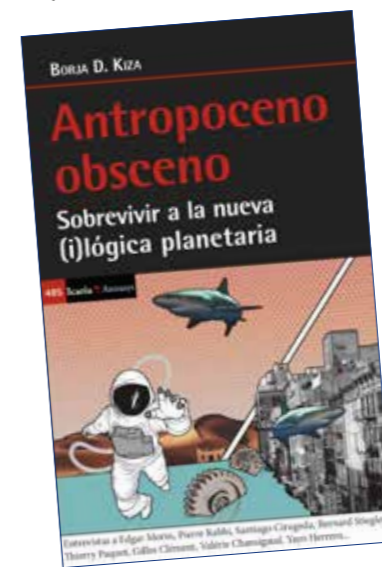
Cubierta del ensayo Antropoceno obsceno. Sobrevivir a la nueva (i)lógica planetaria (Icaria, 2019).

la extrañeza de sentirse, casi inesperadamente, parte de un tiempo que en pocas décadas ha cambiado radicalmente y de manera inquietante la manera de ver y verse en el mundo de una buena parte de la sociedad. Como soy consciente de mis limitaciones, acudo a expertos para ponerlas a prueba, matizarlas, desarrollarlas... Y, curiosamente, veo cómo grandes intelectuales tienen en el fondo las mismas preocupaciones que la gente de a pie. Con la ventaja de que han pensado mucho en ellas y tienen cosas interesantes que decir.